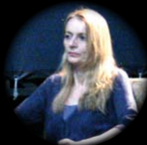
PLANET3/DREAMACHINE, ZTL-PRO, ARMUNIAFESTIVAL INEQUILIBRIO REALITY VENERDÌ 12 APRILE