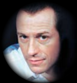
STEFANO ACCORSI FURIOSO ORLANDO 23 E 24 OTTOBRE