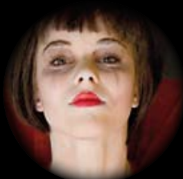
JUNIOR BALLETO DI TOSCANA COPPELIA 23 E 24 FEBBRAIO