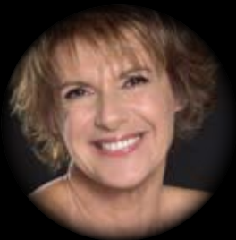
LELLA COSTA ARIE 6 E 7 NOVEMBRE