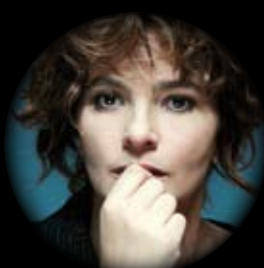
LAURA MORANTE THE COUNTRY 20 E 21 NOVEMBRE