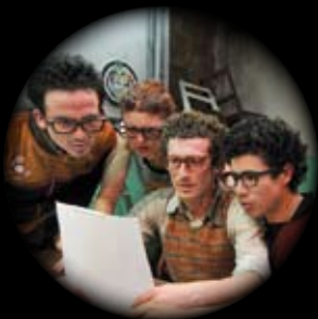
LA RESENTIDA TRATANDO DE HACER UNA OBRA QUE CAMBIA EL MUNDO MERCOLEDÌ 16 GENNAIO