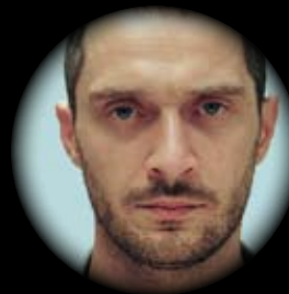
CLAUDIO SANTAMARIA OCCIDENTE SOLITARIO 4 E 5 DICEMBRE