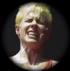
MOTUS ALEXIS. UNA TREGEDIA GRECA VENERDÌ 22 MARZO