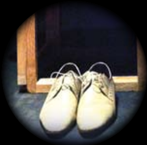
COMPAGNIA MICHELE BANDINI/ FERRI/DE PONTI B-SOGNO VENERDÌ 5 APRILE