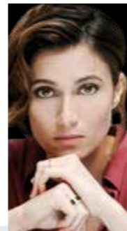
ANNA FOGLIETTA LA PAZZA DELLA PORTA ACCANTO DAL 2 AL 4 FEBBRAIO