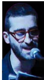
MICHELANGELO BELLANI INFAMI 1 DICEMBRE fuori abbonamento