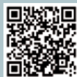
SCARICA IL PROGRAMMA

Stagione di prosa 2015 2016 TEATRO SECCI TERNI