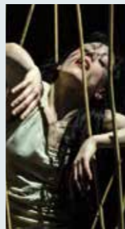
COMPAGNIA ABBONDANZA BERTONI TERRAMARA 21 E 22 GENNAIO Umbria in Danza