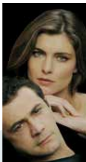
VITTORIA PUCCINI VINICIO MARCHIONI LA GATTA SUL TETTO CHE SCOTTA 7 E 8 DICEMBRE