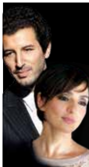
FRANCESCO SCIANNA AMBRA ANGIOLINI TRADIMENTI 16 E 17 NOVEMBRE