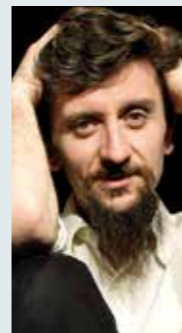
ASCANIO CELESTINI LAIKA DAL 16 AL 18 MARZO